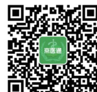
京医通公众微信号

一句话总结服务改善: 七种途径挂号, 号池全部共享, 分时段预约精确到 30 分钟, 减少您在医院排队和等待的时间! 七种挂号渠道挂号方式、开放时间、预约周期等详情介绍如下: 1、京医通。 推荐理由: 随时随地微信挂号、缴费, 方便快捷, 操作简单, 开放知名专家团队门诊、专病专症门诊挂号快速通道, 且可实现全市 22 家公立医院预约挂号。 挂号方式: 关注下方京医通公众号或院内京医通自助机 (20 台) 开放时间: 微信 365 天 *24 小时, 院内京医通自助机 365 天 7:00-18:00 放号时间: 早 7:00 预约周期: 8 天 (含当天) 退号方式: 京医通 - 【个人中心】- 【挂号记录】 退号截止时间: 看诊前一日 24:00